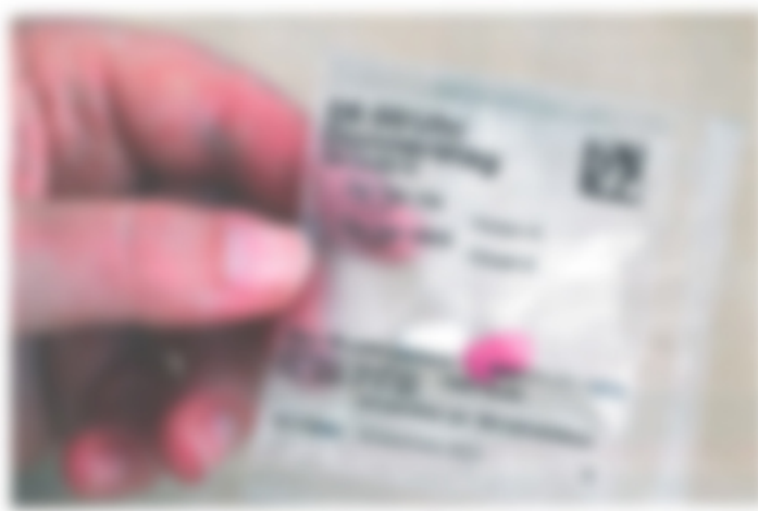
Hand holding a small, pink, cylindrical pill or capsule over a white card with printed text and a barcode.

Die neue TL 404 findet mit 1,5 m Länge und 1,1 m Breite praktisch überall Platz und eignet sich für Packstücke bis 400 mm Breite. Dabei ist sie aber nicht nur kleiner, sondern wurde auch technisch komplett überarbeitet, um höchste Leistung und Zuverlässigkeit zu gewährleisten, so der Hersteller. Unter anderem vereinfacht ein Touchpanel die Bedienung von beiden Seiten, während eine spezielle Dornkonstruktion den