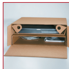
variocrown mit Beipackfach