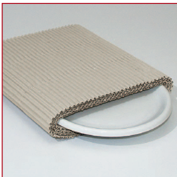
Gli avvolgimenti morbidi proteggono gli oggetti fragili.