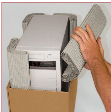
Gli avvolgimenti morbidi proteggono gli spigoli.