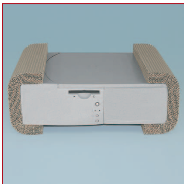
Come protezione per articoli a forma di parallelepipedo.