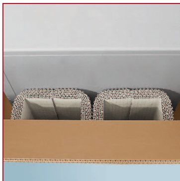
Per coprire dei vani in modo economico.