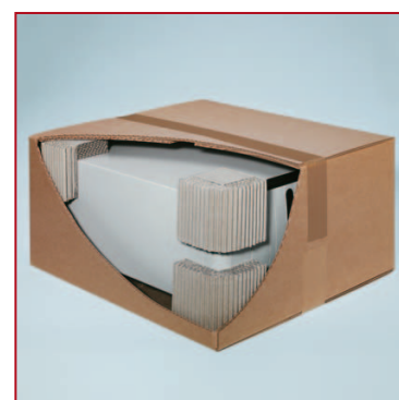
Cornières romwell dans le carton de conditionnement.